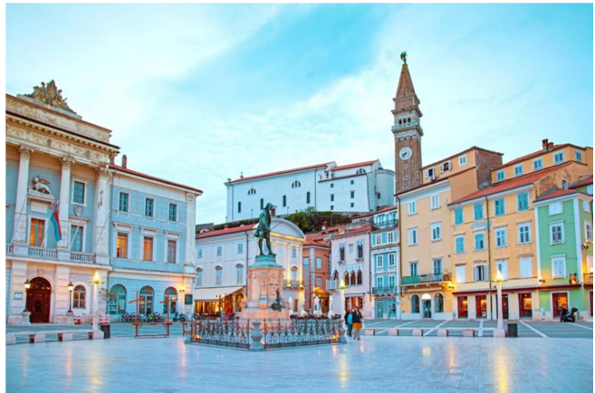
Slika: prikazuje Tartinijev trg

Trg je dobil ime po slovitim in mednarodno priznanem domačinu, violinistu in skladatelju Tartiniju, ki je ime rojstnega kraja (Pirana) ponesel v širni svet. Ob koncu 13. stoletja je Tartinijev trg postal osrednji piranski trg. Današnjo podobo pa je dobil v drugi polovici 19. stoletja. Tako so zasuli mandrač in nastala je prostorna tržna ploščad, okoli katere so zgrajene vse pomembne stavbe v Piranu (občinska in sodna palača). Trg obdajajo tudi številne meščanske stavbe, ki katere so izgubile svojo prvotno obliko. Z izjemo ene čudovite gotske stavbe, katera je danes znana pod imenom Benečanka.