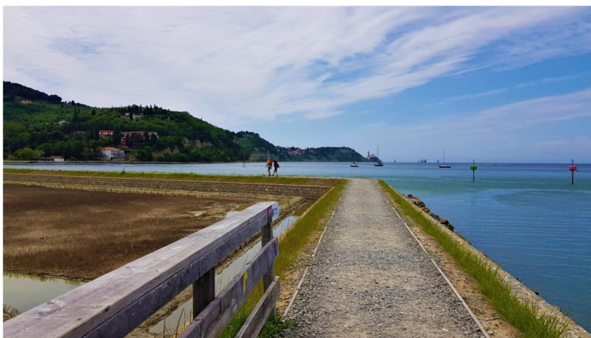
Slika prikazuje strunjanske soline

V Strunjan bodo prispeli ob 8.50 pred hotel Salinera. Po prihodu se bo skupina peš odpravila na pot proti Piranu. Pred izletom si bomo ogledali Strunjanske soline in nato nadaljevali pot po lokalni cesti, ki nas vodi mimo zaliva Svetega Duha. Vzpeli se bomo po cesti nad Strunjanom, dokler nas smerokazi ne bodo usmerili proti Pacugu. Sledili bomo pešpoti, ki nas vodi skozi gozdnato pot visoko nad morjem katera nas pripelje do naselja Pacug. Na razpotjih se bomo držali oznak za Fieso, kjer se cesta precej strmo spusti do jezera in obale. Iz Fiese bomo nadaljevali po znani betonirani pešpoti pod klifom, ki nas pripelje neposredno v Piran do cerkve svetega Jurija.