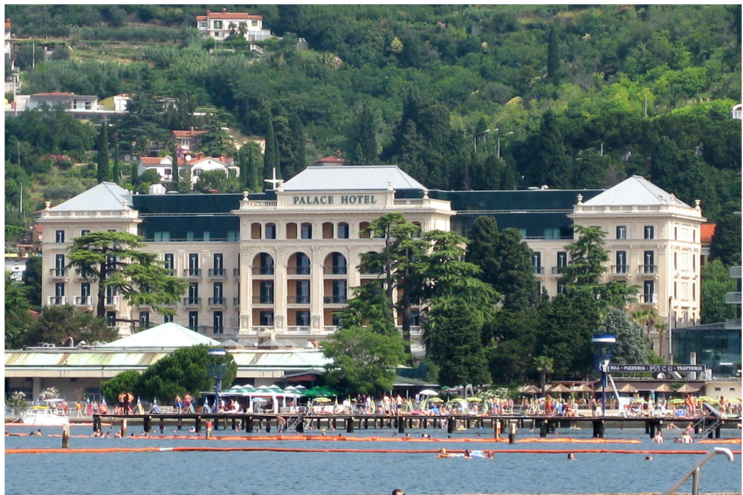
Slika: prikazuje Palace hotel v Portorožu

Portorož (Portorose) je obmorsko naselje v Slovenski Istri, z malo manj kot 3000 stalnimi prebivalci. Nahaja se na severni obali Piranskega zaliva v občini Piran in je pomembno turistično, kopališko in zdraviliško središče, s številnimi nastanitvenimi kapacitetami v hotelih in penzionih. Naselje je na območju, kjer avtohtono živijo pripadniki italijanske narodne skupnosti in kjer je poleg slovenščine uradni jezik tudi italijanščina. ( Portorož )