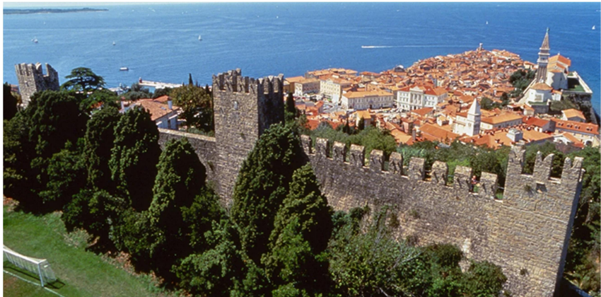
ika: prikazuje piransko obzidje

Najlepše ohranjena gotska vrata (15. stoletje) so bila postavljena po naročilu takratnega župana, po katerem so tudi poimenovana: Dolfinova vrata spoznamo po značilnem grbu s tremi delfini. ( Piransko obzidje )