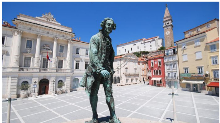
Slika: prikazuje Tartinijev