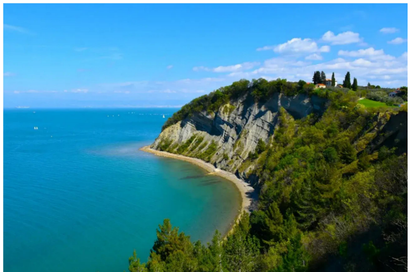
Slika: prikazuje Mesečev zaliv v Strunjanu

Strunjan (Strugnano) je razloženo obmorsko naselje v Slovenski Istri, med Izolo in Piranom, s skoraj 700 prebivalci. Leži ob Strunjanskem zalivu in v istoimenski dolini ob potoku Roje in ob njegovih pritokih, tudi na prisojnih pobočjih griča Ronek (116 m n. v.), ki se na severu strmo spušča proti zalivu sv. Križa in se konča z visokim flišnim klifom. Na koncu Strunjanskega zaliva so v območju Krajinskega parka Strunjan najmanjše in najsevernejše soline na Jadranu, še delujoče Strunjanske soline. ( Strunjan )